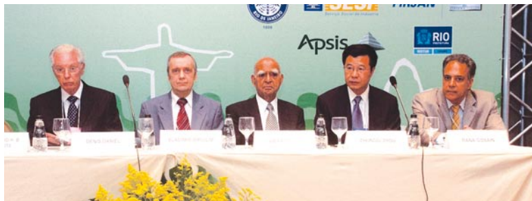
НА ФОТО: ПРЕЗИДИУМ ФОРУМА

На 3-м Годовом Форуме по интеллектуальной собственности стран BRIC «Актуальные вопросы обеспечения прав на интеллектуальную собственность на развивающихся рынках» с докладами выступили Партнеры фирмы «Городисский и Партнеры» (Москва)